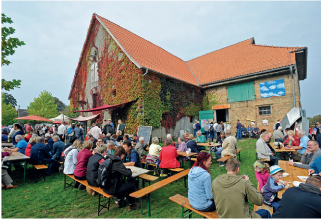
Markttag 2014

Über 2000 Besucher kamen zum Markt um den Rothener Hof. 50 Händler hatten ihre Stände aufgebaut, 3 Schweine am Spieß wurden verzehrt, 35 Bleche mit Kuchen und unendliche Ströme von Kaffee stärkten die Gäste. Die Händler waren zufrieden, die Besucher genossen die entspannte Stimmung und das herrliche Herbstwetter. Der Markt in Rothen ist die größte Veranstaltung in unserer Gemeinde, die jährlich vom Verein Rothener Hof organisiert wird.