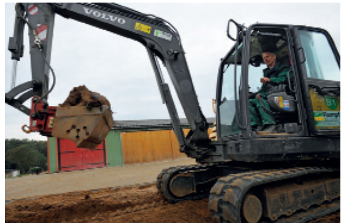
Bauarbeiten am Feuerwehrvorplatz

Die Arbeiten hierfür laufen auf vollen Touren. Der Bereich wird mit einer Pflasterung und Grün-