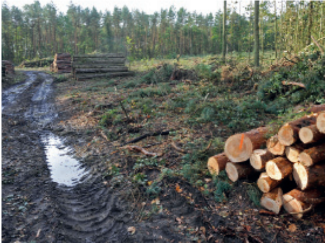
Kahlschlag in den Rothener Tannen