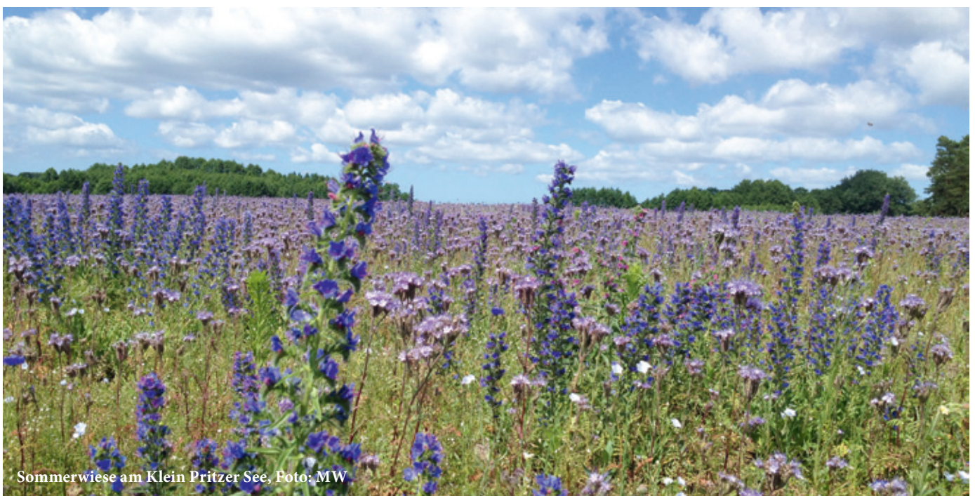
Sommerwiese am Klein Pritzer See