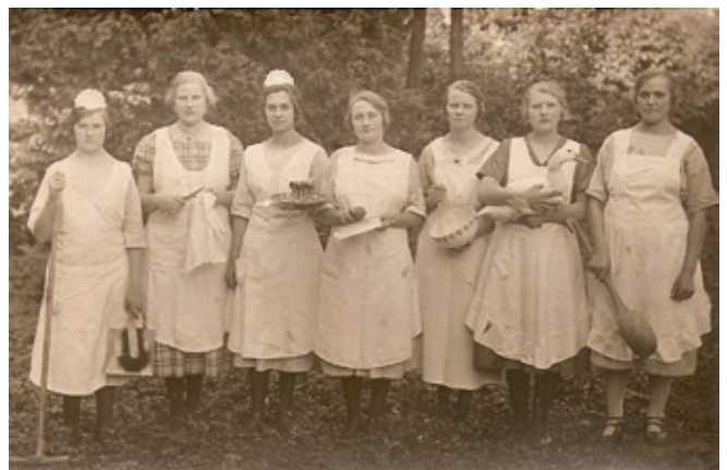
Hauspersonal aus dem Gutshaus Woserin