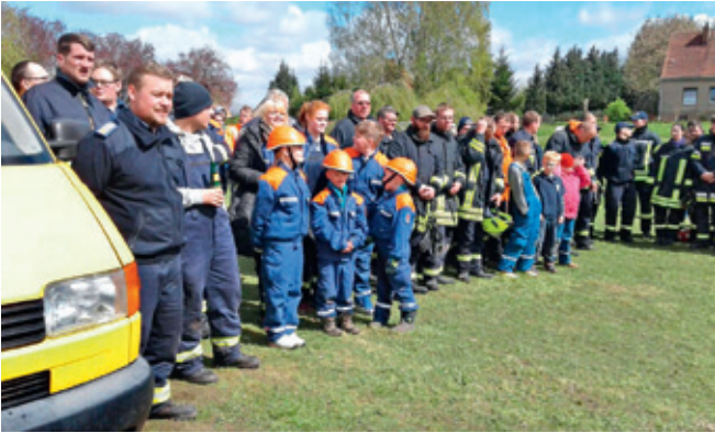
Ansprache zum Amtswehrtreffen