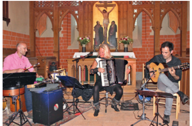
Konzert in der Woseriner Kirche, Foto: K. Otolski

Am 5. August und am 2. September wird es in Ruchow zwei weitere Konzerte geben. Und am 12. August erklingt eine sommerliche Serenade unter dem Motto „Telemann et cetera“ in der Woseriner Dorfkirche. Für die dringend sanierungsbedürftige Kirche in Gägelow hat sich einiges getan. Eine Berliner Gemälderestauratorin hat sich spontan bereiterklärt, das Altarbild kostenlos zu restaurieren. Der Dabeler Kirchenvorstand hat beschlossen,