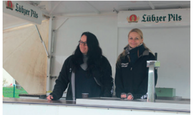
Die Bardamen, Foto: MJ