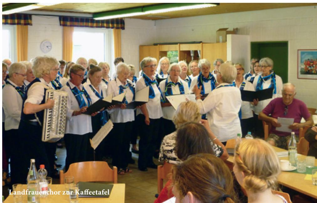
Landfrauenchor zur Kaffeetafel