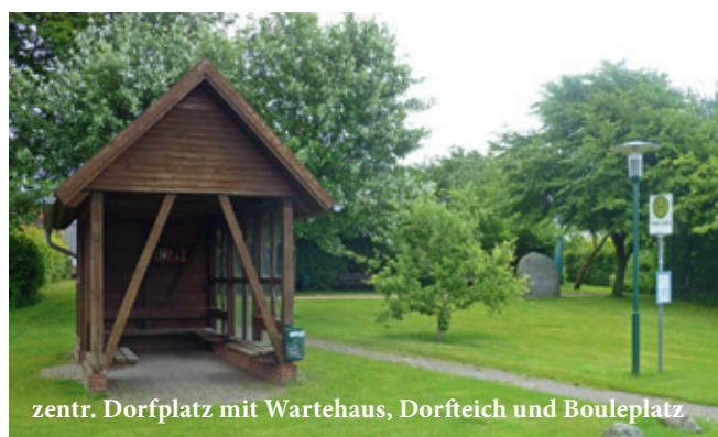
zentr. Dorfplatz mit Wartehaus, Dorfteich und Bouleplatz