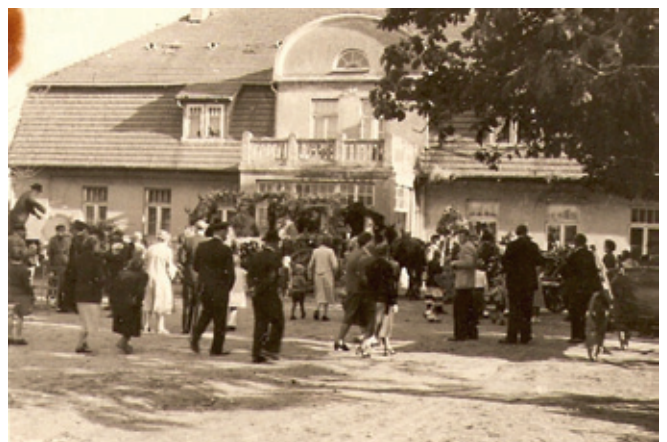
Erntedankfest vor dem Woseriner Gutshaus