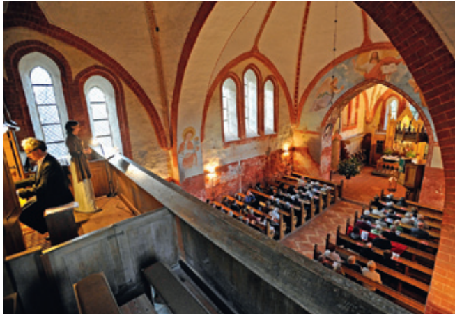
Konzert in der Gägelower Kirche

Am 20. Mai fand das erste Konzert in der Reihe „Musik in alten Mauern-Sommerkonzerte in Dorfkirchen“ statt. Fast 100 Besucher kamen in die 750 Jahre alte Dorfkirche in Gägelow, die traditionell für Rothen zuständige Kirche. Auch die Konzerte in der Dorfkirche von Ruchow und Woserin waren sehr gut besucht.