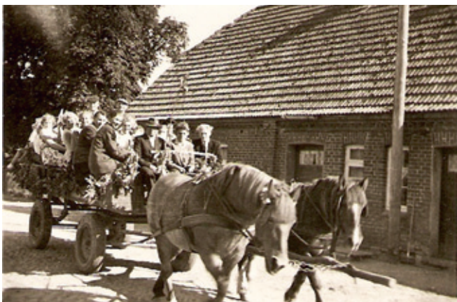
Erntedank - Umzug in Woserin