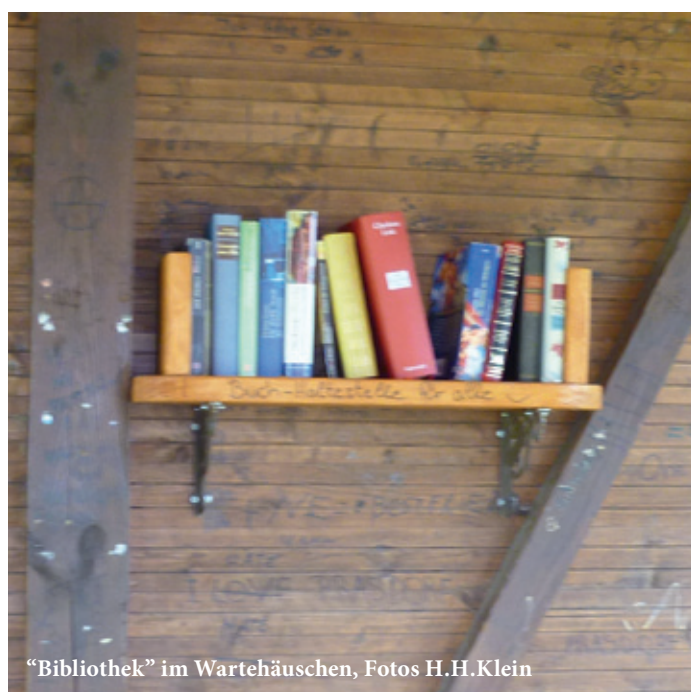
“Bibliothek” im Wartehäuschen, Fotos H.H.Klein