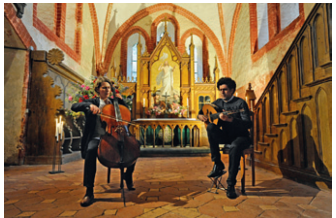
Konzert in Gägelow mit Cello und syrischer Laute, Foto: CL

einen Förderverein für die Gägelower Kirche ins Leben zu rufen und die Kirchenverwaltung plant für 2019 die Sanierung des Kirhdachstuhls in Angriff zu nehmen. CL