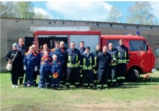
Feuerwehr Borkow