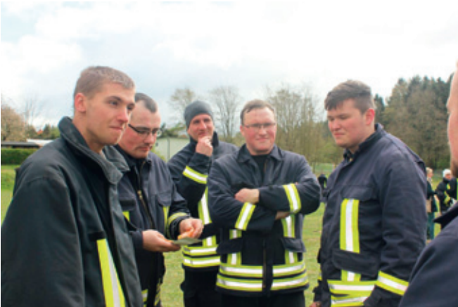
kurze Verschnaufpause