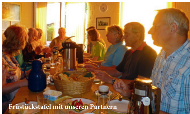
Frühstückstafel mit unseren Partnern