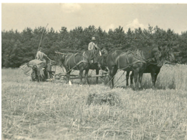
Pferdegespann in Rothen, 40iger Jahre