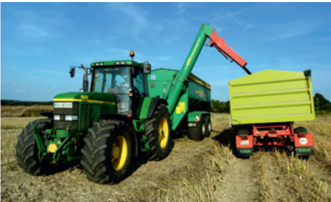
Ernte in Rothen 2005