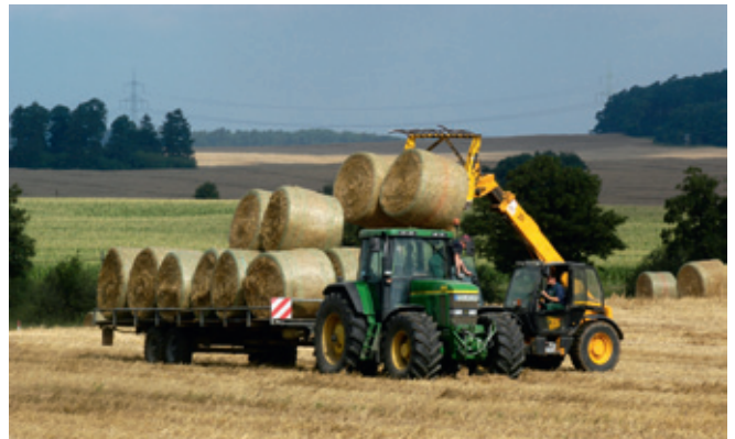
Einbringen der Strohballen, Borkow, 2007