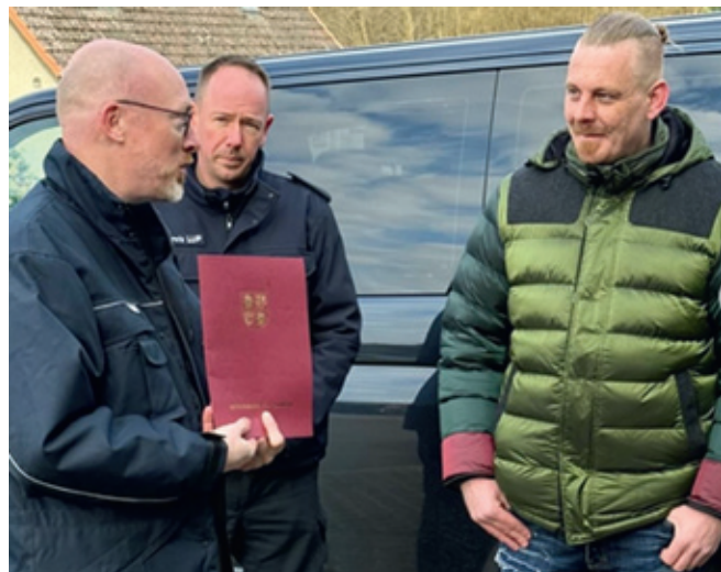
Innenminister Christian Pegel übergibt Bürgermeister Wagner die Zusage des Landes M-V zur Förderung eines neuen Feuerwehrgerätehauses.

Aufgrund des starken Schneefalls in der letzten Winterperiode, liegen die Ausgaben für den Winterdienst weit über dem Planungsansatz.