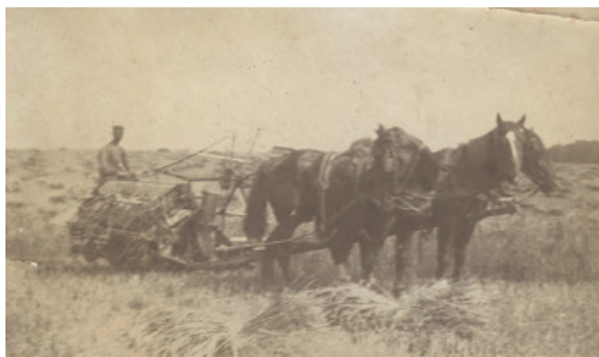
Pferdegespann auf der Rothener Feldmark, 20iger Jahre