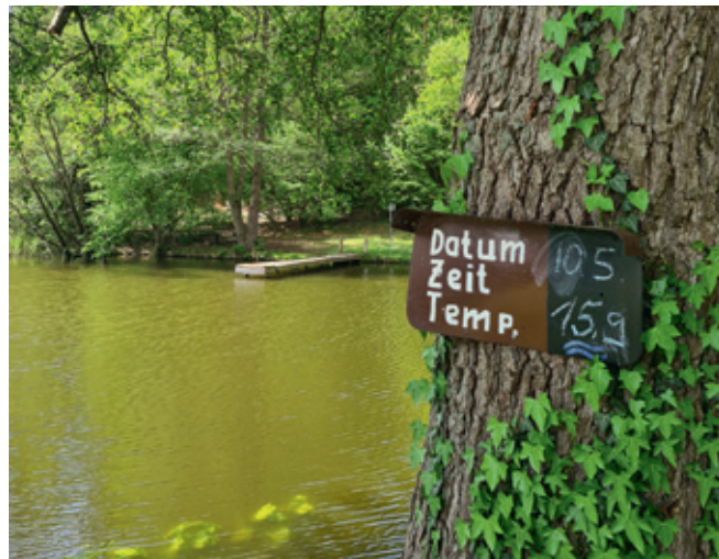
Wassertemperatur in Borkow

Für alle Badelustigen wird immer die Temperatur des Wassers tagesaktuell angezeigt. Sowohl am Borkower See als auch am Kleinpritzer See in Schlowe.