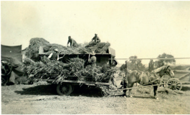
Oertzen-Karren in Rothen