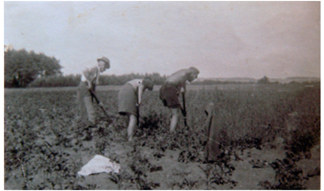
Familie Vogelgesang bei der Feldarbeit in Rothen, 50iger Jahre