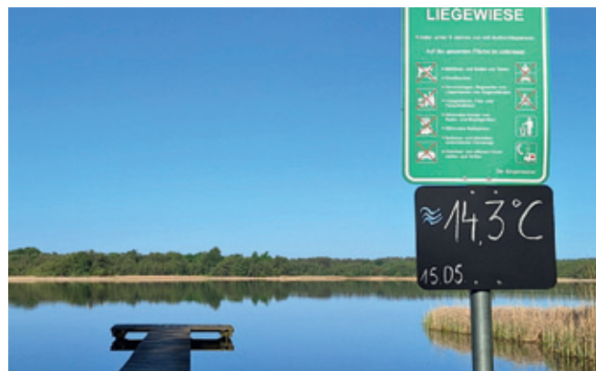
Wassertemperatur in Schlowe